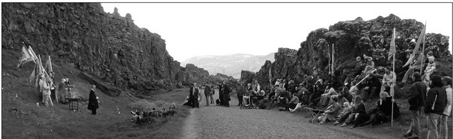
Frá athöfninni í Almannagjá, 21. júní sl.